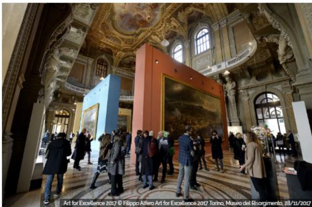
Art for Excellence 2017 Art for Excellence 2017 Torino, Museo del Risorgimento, 28/11/2017