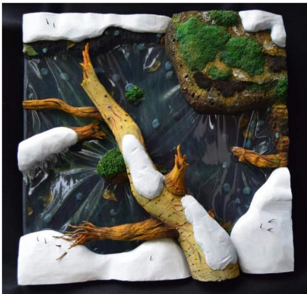
Piero Gilardi. Tronco nell'acqua cm 100x100 per Gruppo Ferrero. Art for Excellence 2017